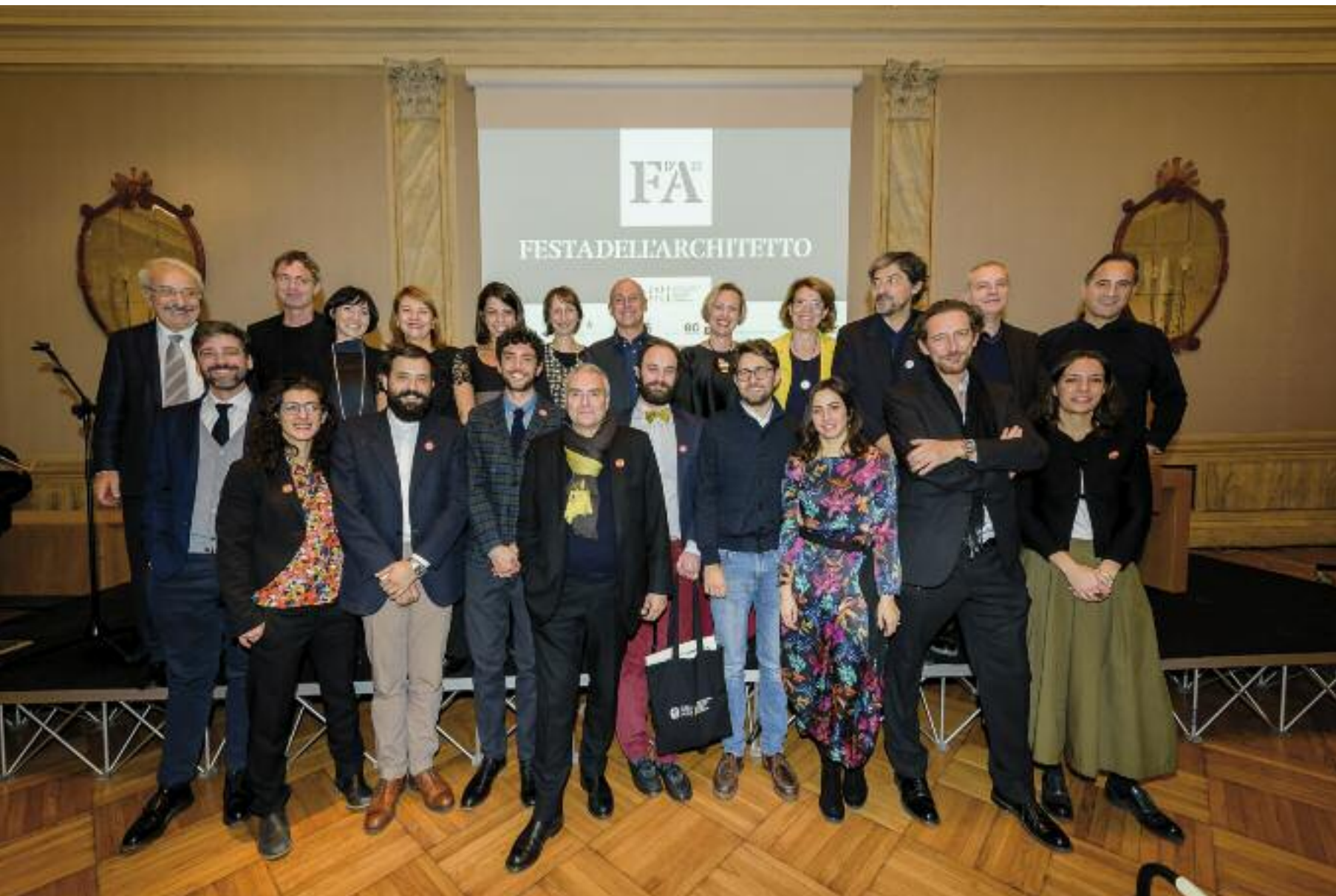
Festa dell'architetto 2018, Venezia, Ca' Giustinian sede della Biennale di Venezia