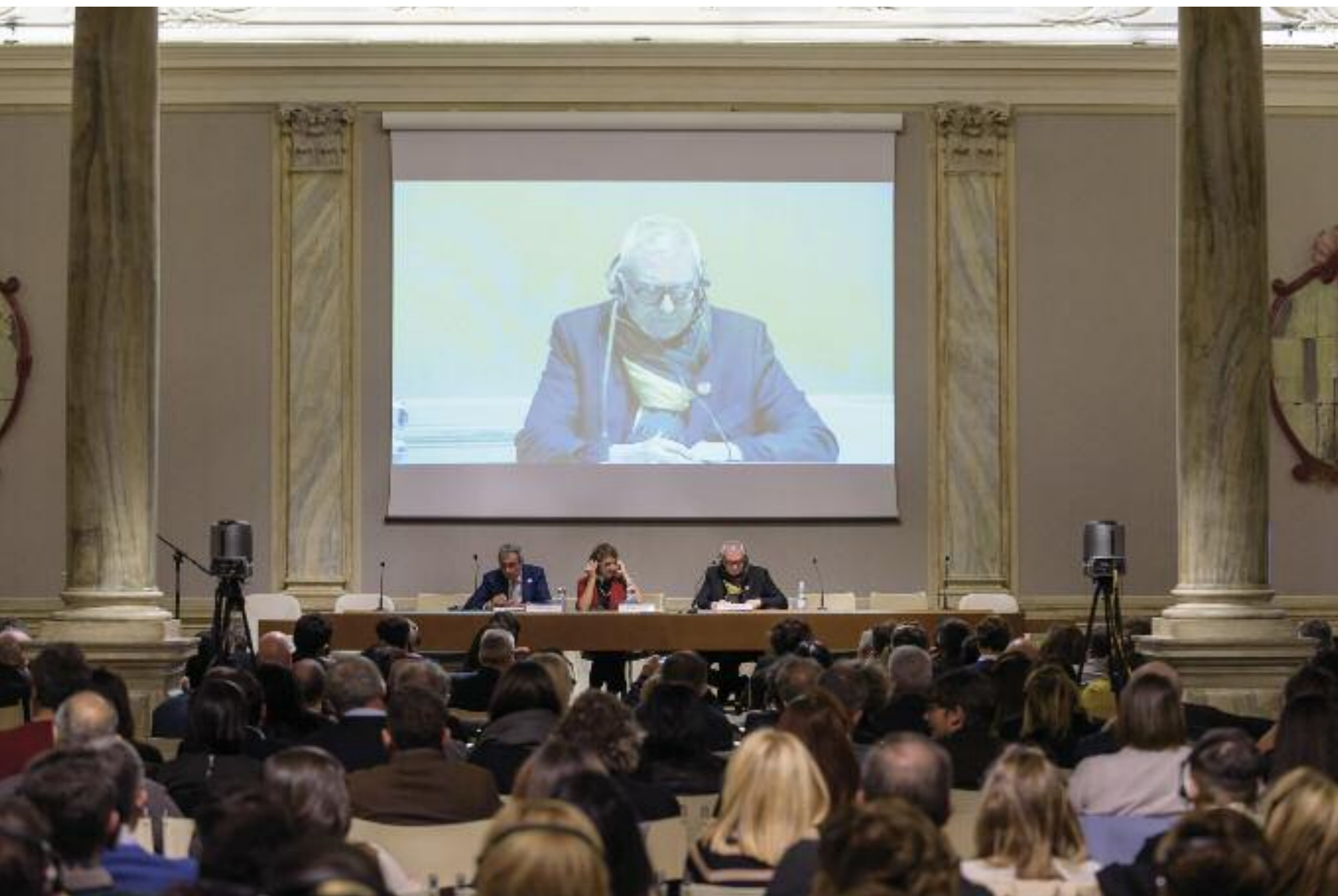
Festa dell'architetto 2018