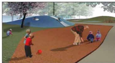
■ Il boulevard urbano del gruppo di Pedrali

mente urbano - spiega il team - diviene teatro di una contaminazione linguistica che vede gli elementi naturali propri dell'ambiente rurale inserirsi all'interno del tessuto della città». Particolare attenzione alla sostenibilità ambientale: il boulevard diventa una «macchina bioclimatica» in grado di influire sul microclima del tessuto urbano.