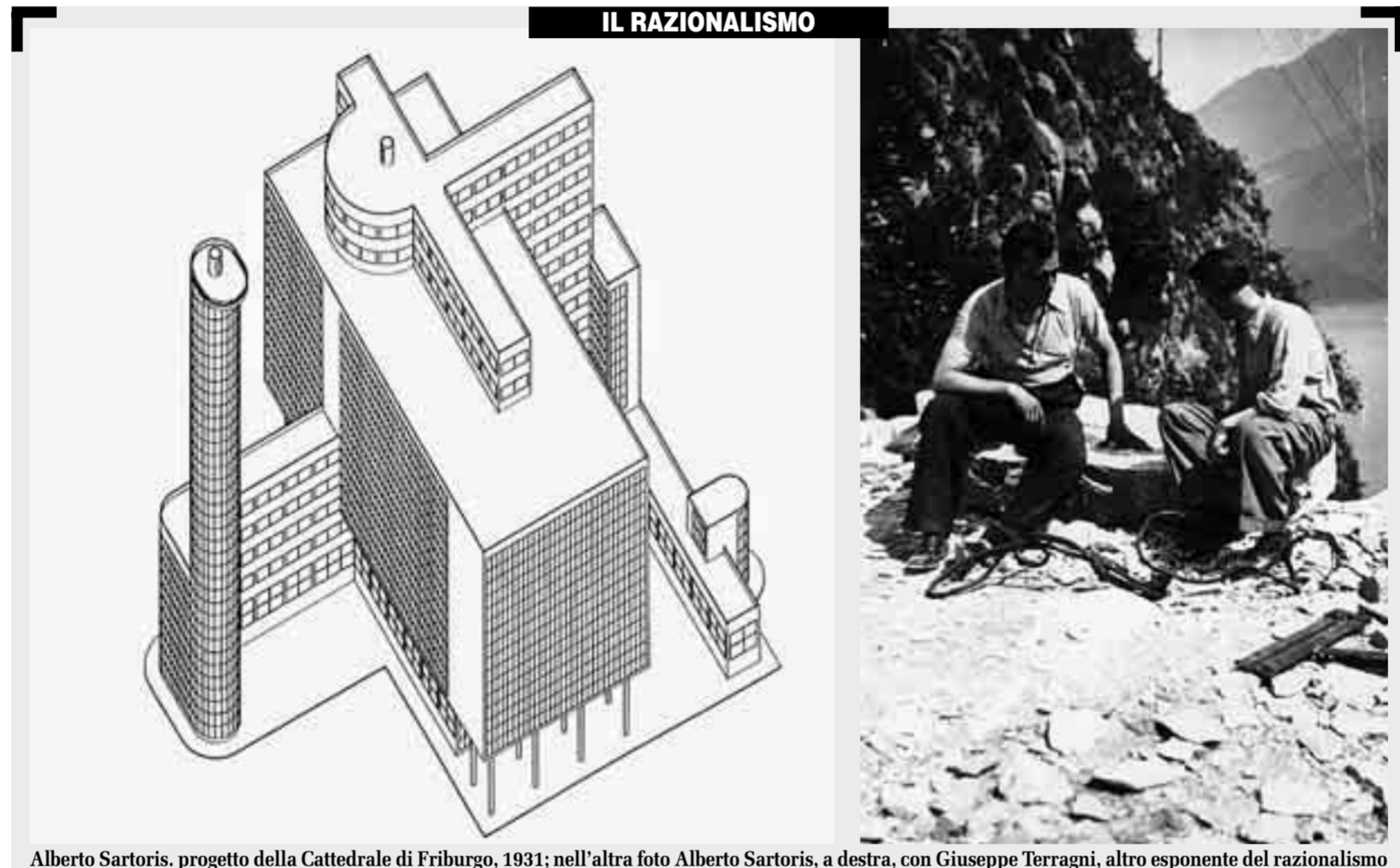
Alberto Sartoris, progetto della Cattedrale di Friburgo, 1931; nell'altra foto Alberto Sartoris, a destra, con Giuseppe Terragni, altro esponente del razionalismo

Alberto Sartoris è un protagonista autentico degli eventi che cambiarono il destino della architettura: lo ricordano critici d'architettura come Kenet Framptom, lo analizzano Cesare de Seta e Bruno Reischlin, grandi architetti contemporanei, lo frequen-