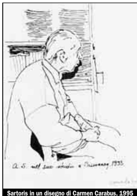
Sartoris in un disegno di Carmen Carabus, 1995