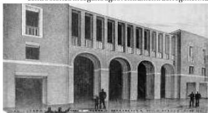
Foto d'epoca e progetti dell'Istituto per le Case popolari sorto nel 1903 per segnare lo sviluppo urbanistico di Roma. Dall'Appio al Trionfale, da Monteverde alla Garbatella

Le case popolari come gioielli déco immersi nel verde