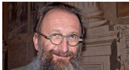
Michele De Lucchi