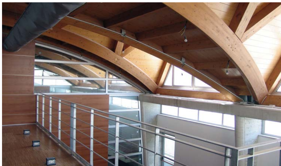
Nelle immagini, i volumi interni ed esterni della nuova sede della Facoltà di Architettura di Pescara. Progetto Ludovico Micara, coordinamento Antonino Di Federico

La versione integrale dell'intervista si trova sul sito www.avm.it (Home, Attività, Interviste ...)